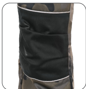
zesílená kolena reinforced knees kolana wzmocnione