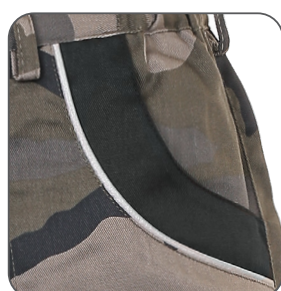
reflexní výpustky reflective stripes paski odblaskowe