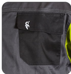
náprsní kapsa s klopou chest flap pocket kieszeń na piersi z patką